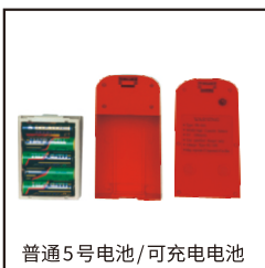
普通5号电池/可充电电池